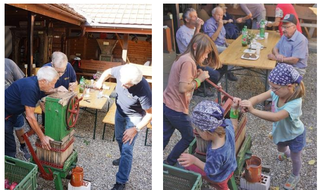
Jung und Alt beim Mosten

So gestärkt lässt sich ein Rundgang durchs Museum ins Auge fassen, begonnen über die 'Vorräte' an altehrwürdigen Gerätschaften im Depot, durch die Galerie und in den bald vierhundert Jahre alten Doppelspycher bis hinab in den Gewölbekeller. Äonen zurück liegt die Lebenszeit der Exponate, die nun hier lagern. Ihr Lebensraum aber war das Meer, das sich hier vor 165 Millionen Jahre ausbreitete und uns in fossiler Form besterhaltener Seesterne, Seeigel, Seelilien und Seegurken in Erinnerung gerufen wird.