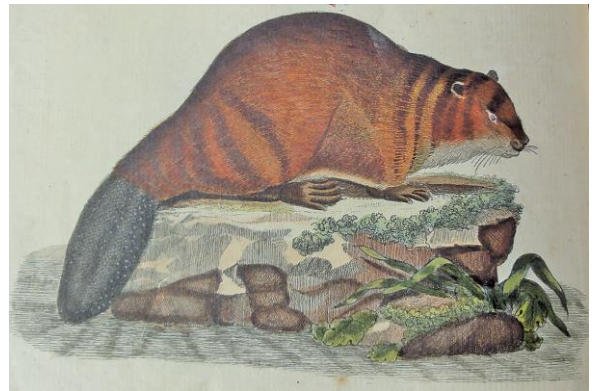
Biberdarstellung aus einem Schulbuch für Fürstenkinder aus dem Jahre 1792

Die nächste Biberfamilie lebt nämlich seit etlicher Zeit am Längibach, selbst fast unsichtbar, doch mit Dämmen und Stauweihern durchaus präsent. Zwar kann sich die Biberfamilie nun freier bewegen, da die Abraumberge vom Bözbergtunnel verschwunden sind, doch tut sie das eben sehr diskret. Die Ausstellung im Heimatmuseum soll nun etliche Geheimnisse des Biberlebens etwas lüften helfen. Schon 30 Millionen Jahre gibt es die Biber in ähnlicher Form. Über die Jahre hat sich ihre Lebensweise immer mehr Richtung Wasser verschoben, wie sich das unsrige eben meistens in den Sommerferien tut.