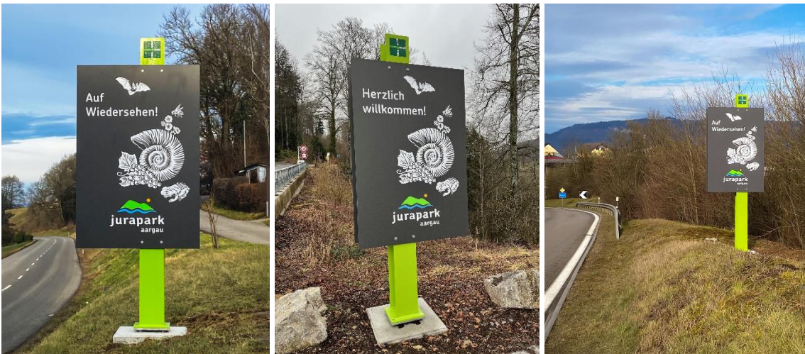
Fertig montierte Tafeln in Zeiningen, Saalhöhe und Eiken

Sechs Eingangstafeln wurden bis jetzt montiert