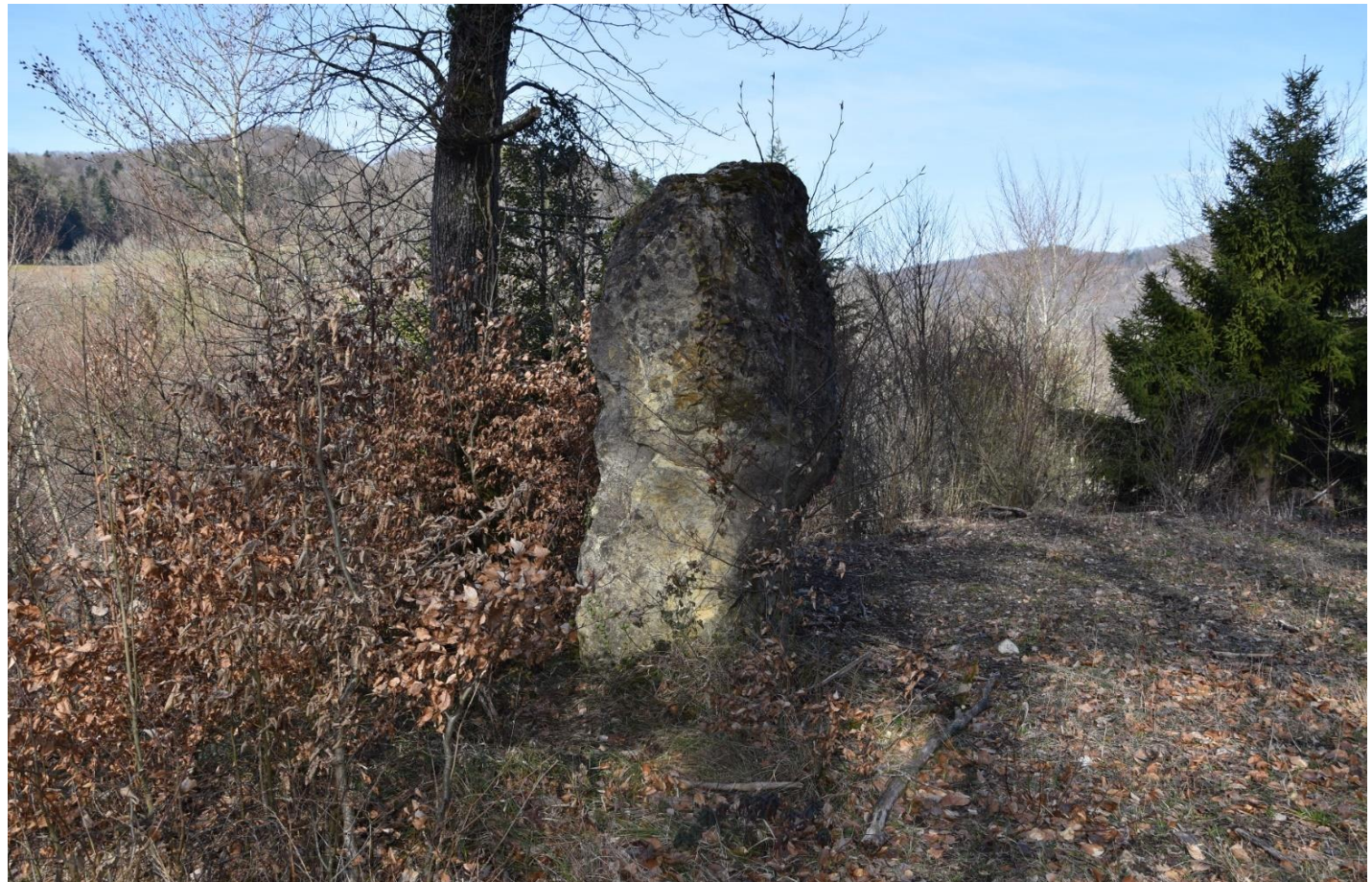
Findling aufgestellt von der Bau-Firma Gebrüder Meier aus Brugg Westseitig schwach noch sichtbar Beschriftung : Gebr. Meier Brugg