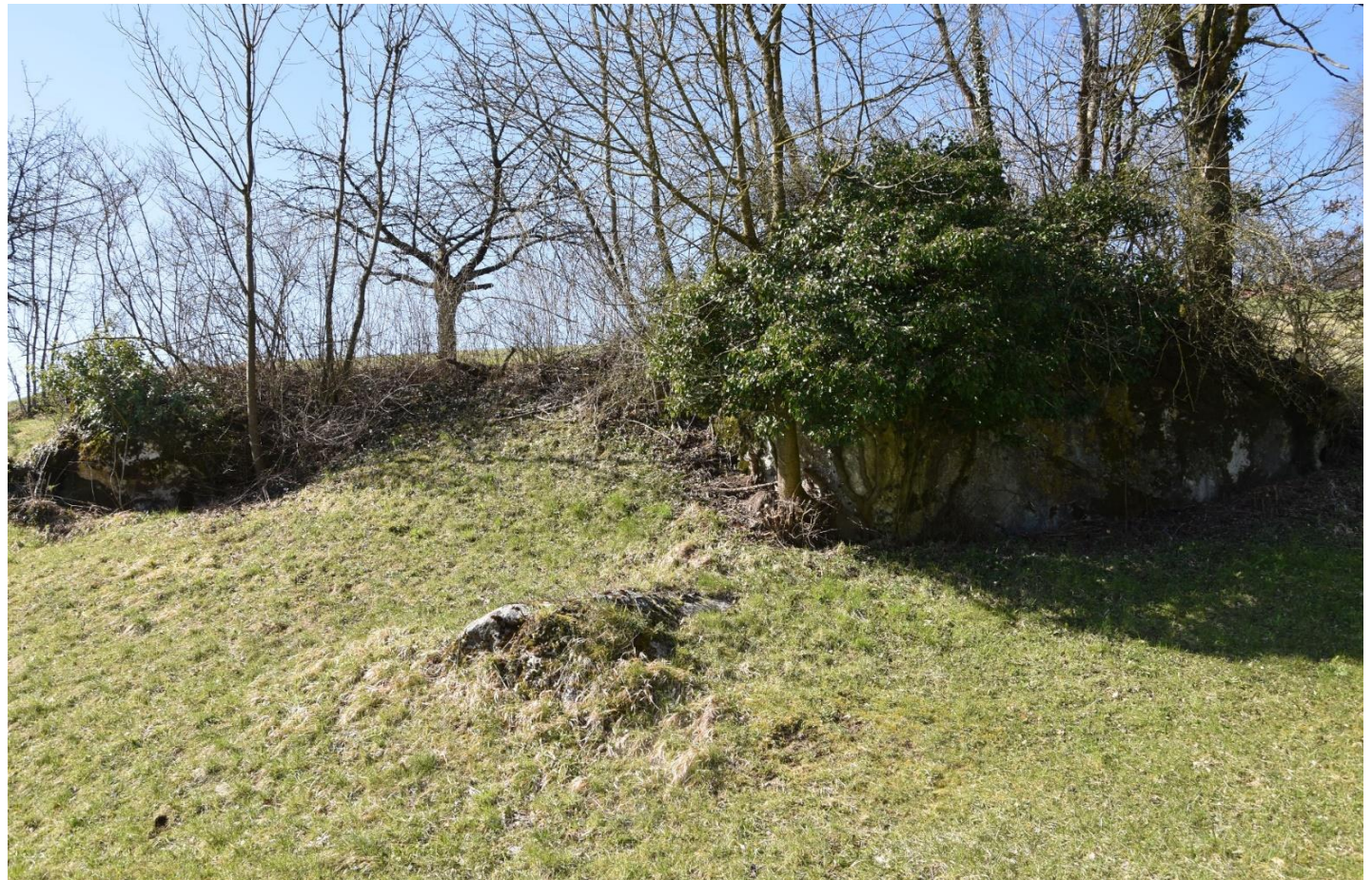
Eiszeitliche Verfrachtung von Korallenkalk-Findlingen vom Gislifluhgipfel GEF2_ID 65025500 Agis geomorphologisches Inventar Kanton Aargau